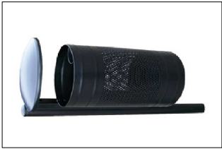
2 – KOSZ (dł. 150 cm)