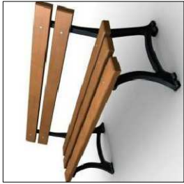
1 – ŁAWKA (dł. 150 cm)